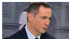
M. Gilles SIMEONI, Président de l'Exécutif de la Collectivité Territoriale de Corse

La professionnalisation de la gestion de l'activité thermale est une nécessité, et, je souhaite toutefois préciser ma volonté de voir émerger les compétences locales qui seront à même d'assurer et de garantir la pérennité des emplois générés par cette activité. »